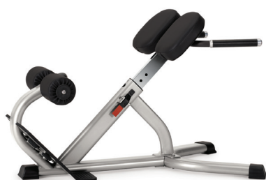
EXTENSIÓN DE ESPALDA 45 GRADOS 9NN-B7502