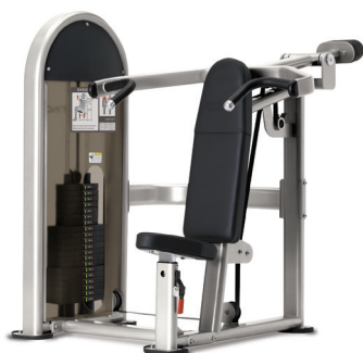
PRESA DE HOMBROS 9NL-S4100