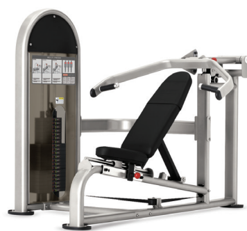
MULTIPRENSA DUAL 9NL-D2120