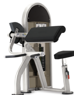
FLEXIÓN DE BÍCEPS 9NL-S5100