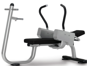
BANCO DE ABDOMINALES 9NN-B7505