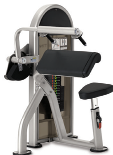
EXTENSIÓN DE TRÍCEPS I 9NL-S5110