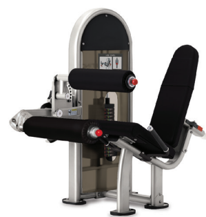
FLEXIÓN DE PIERNAS 9NL-S1011