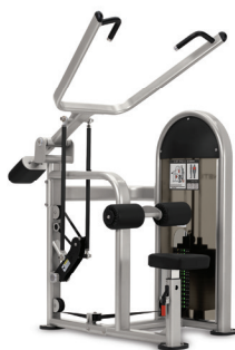
TRACCIÓN LATERAL 9NL-S3310