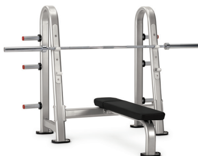
BANCO OLÍMPICO PLANO 9NN-B7503