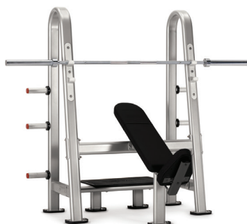
BANCO OLÍMPICO INCLINADO 9NN-B7201