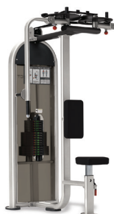
APERTURA DE PECHO/DELTOIDES TRASERO DUAL 9NL-D2110