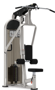
TRACCIÓN LATERAL/REMO VERTICAL DUAL 9NL-D3340