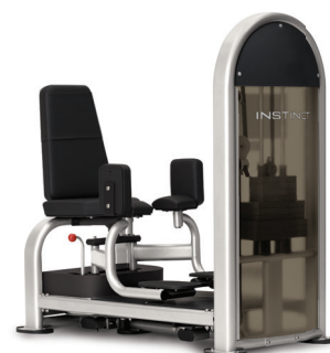
ADUCTOR / ABDUCTOR DUAL 9NL-D1015