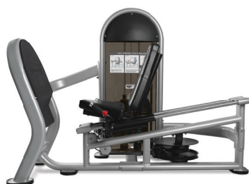
PRENSA DE PIERNAS/ ELEVACIONES DE GEMELOS DUAL 9NL-D1013