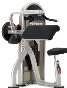
FLEXIÓN DE BÍCEPS/EXTENSIÓN DE TRÍCEPS DUAL 9NL-D5120