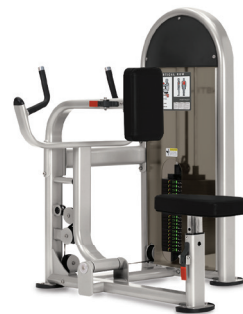
REMO VERTICAL 9NL-S3320