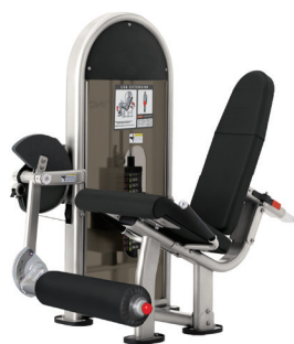
EXTENSIÓN DE PIERNAS 9NL-S1010