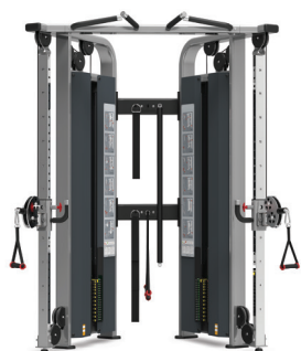
POLEA DOBLE AJUSTABLE 9NL-D2002