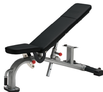
BANCO MULTI-AJUSTABLE 9NN-B7501