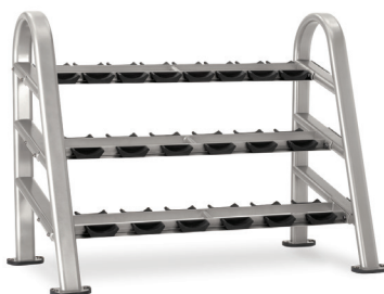
SOPORTE PARA MANCUERNAS DE 10 PARES/3 ESTANTES 9NN-R8002