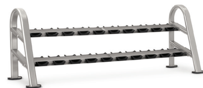
SOPORTE PARA MANCUERNAS DE 10 PARES/2 ESTANTES 9NN-R8001