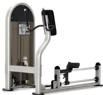
PRENSA DE GLÚTEOS 9NL-S1012