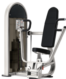
PRENSA DE PECHO 9NL-S2100