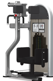
ROTACIÓN DE TORSO 9NL-S6300