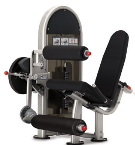
EXTENSIÓN/FLEXIÓN DE PIERNAS DUAL 9NL-D1014