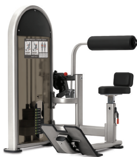
ABDOMINAL LUMBAR DUAL 9NL-D6330