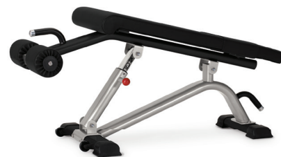
BANCO INVERTIDO DE ABDOMINALES AJUSTABLE 9NN-B7200